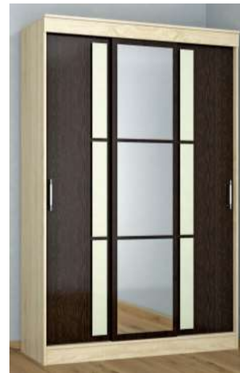
Схема сборки изделия Шкаф-купе Стиль 1600 2200*1600*540