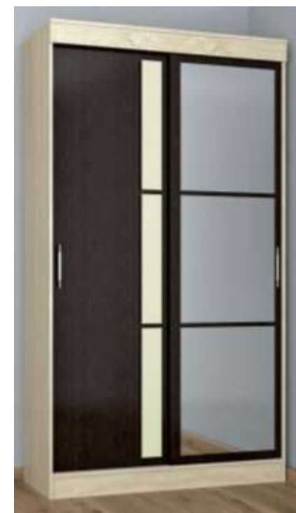
Схема сборки изделия Шкаф-купе Стиль 1200 2200*1200*540