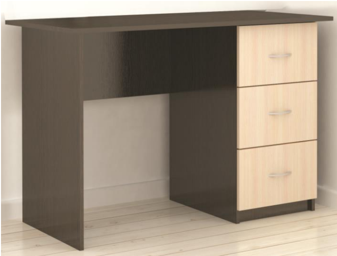
Схема сборки изделия Стол письменный СИТИ 1 750*1200*600