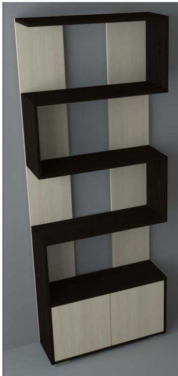
Схема сборки изделия стеллаж Ромео 2 1800*700*250