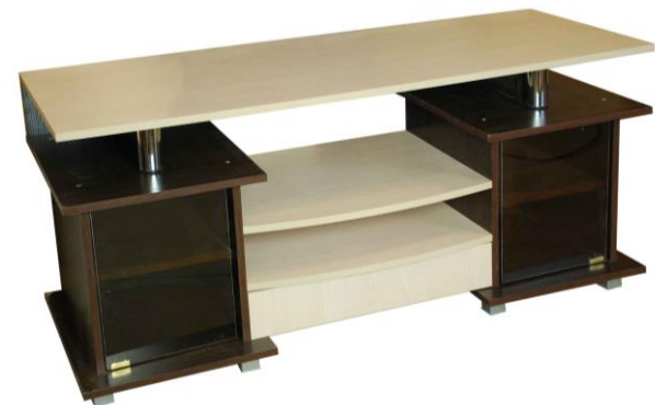
Схема сборки изделия Тумба ТВ 003(к2) 608*1300*410